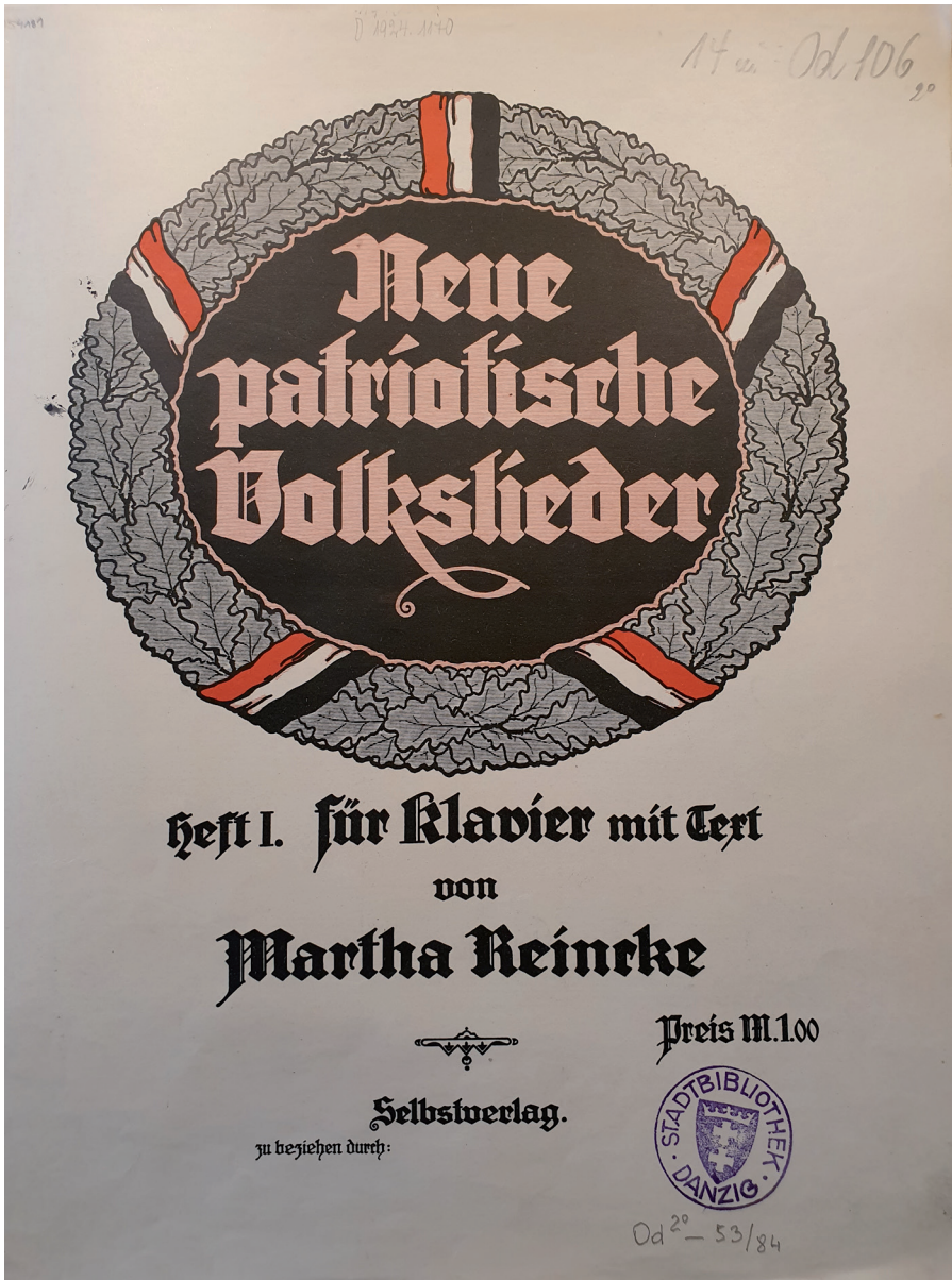
Ilustracja 1. Karta tytułowa Neue patriotische Volkslieder , zbiory PAN Biblioteki Gdańskiej, sygn. Od 106 2° adl. 14